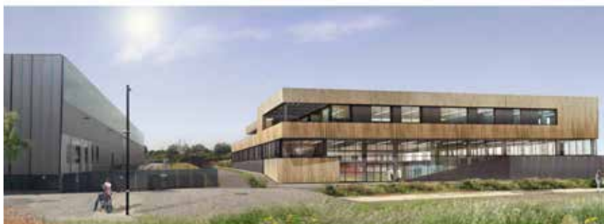
Perspective du projet

À partir de novembre 2015, un nouveau chantier démarre à l'Union : un immeuble de bureaux construit par le promoteur Téréneo. Ce bâtiment de 3 niveaux, d'une surface de 3 498m 2 , prendra place le long de la rue des Métissages, juste au nord du CETI.