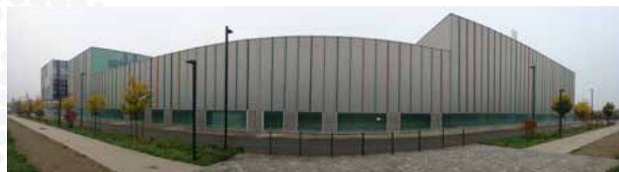
Rue des Métissages

L'aménagement de cette rue se fera dans le même esprit que l'avenue de l'Union. Elle comprendra deux trottoirs, une chaussée limitée à 30km/h, une piste cyclable bidirectionnelle et une noue paysagère.